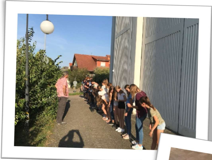
Kooperationsspiele in und um die Arche