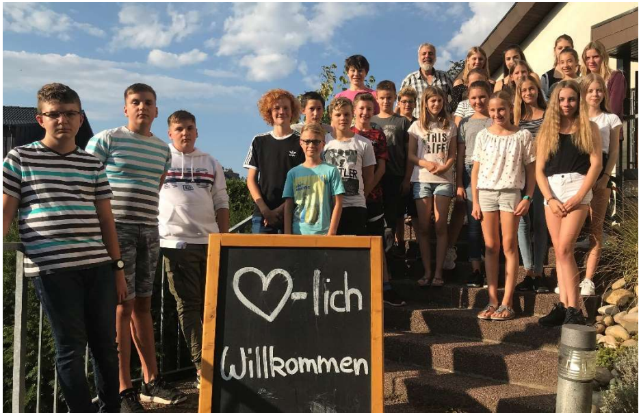
Konfirmandenjahrgang 2018/2019 - Gruppenfoto vor der Arche